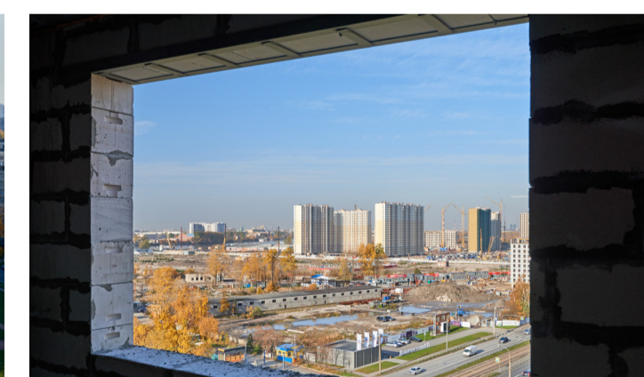
с видом из окна на р. Неву