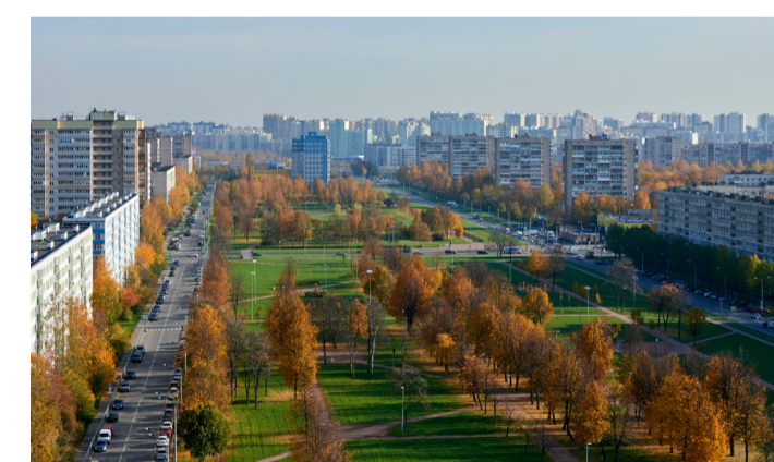
Комплекс в парковой зоне